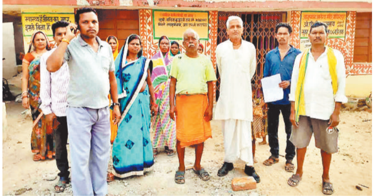
उप स्वास्थ्य केन्द्र के सामने मौजूद ग्रामीण।