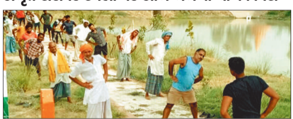
योग का अभ्यास करते लोग।

मनेन्द्रगढ़। भारत सरकार द्वारा स्वास्थ्य कल्याण और प्रकृति के साथ सद्भाव को बढ़ावा देने के लिए अमृत सरोवर स्थलों पर 21 जून को अंतरराष्ट्रीय योग दिवस का आयोजन करने के लिए निर्देशित किया गया है। अमृत सरोवर स्थलों पर स्थानीय समुदाय, आमजन, सरकारी अधिकारियों-कर्मचारियों एवं हितवाहियों के लिए योग सत्र आयोजन किया जाना है। इसमें आसन, प्राणायाम (सांस लेने के लिए व्यायाम) और ध्यान संबंधित क्रिया शामिल किया जाएगा। इसके साथ ही योग के लाभों और स्वस्थ शैली जीवन को बनाए रखने के महत्व पर संशोधी एवं परिचर्चा किया जाना है। गाम, गाम पंचायतों के आमजन, हितवाहियों को आयोजन से संबंधित सभी गतिविधियों के बारे में सूचित कर आयोजन में भाग लेने के लिए प्रोत्साहित किया जाए, इससे शारीरिक एवं मानसिक विकास हो सकेगा। गांव में निर्मित अमृत सरोवर के पास योग अभ्यास के साथ जल संरक्षण, जल संवर्धन की महत्वाकं प्रति समझ विकसित करना है। योग अभ्यास के दौरान गामों में जहां एक ओर स्वस्थ जीवन की राह खुलेंगे तो दूसरी ओर सामाजिक समरसता आजीविका संवर्धन गतिविधियों भी कार्ययोजना तय करेंगे।