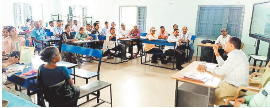
विकास खंड स्तरीय प्रशिक्षण के दौरान उपस्थित शिक्षक।